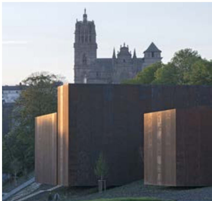
© RCR / musée Soulages. Photothèque Rodez agglomération. Photo : A. Meravilles RCR Architectes : R. Aranda, C. Pigem, R. Vilalta / G. Tregouët. En collaboration avec Passelac & Roques Architectes