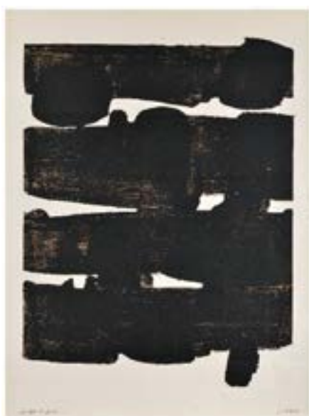
Pierre Soulages, Lithographie n°12, 1964, musée Soulages Rodez

PARCOURS DANS LES COLLECTIONS : SOULAGES ET L'ALLEMAGNE