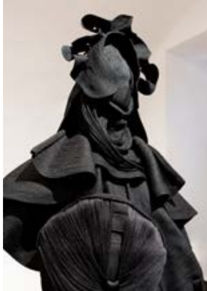
GARDIENNE, 2020. Pièce réalisée en cordes et fils entièrement à la main. 1000h de travail. Vue de l'exposition annuelle des pensionnaires de l'Académie de France à Rome "Dans le tourbillon du tout-monde", commissariat de Lorenzo Romito, Villa Médicis, Rome, juillet-septembre 2020.

RENCONTRE : JEANNE VICÉRIAL AU MUSÉE SOULAGES