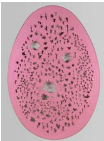
Fontana Lucio. Concetto spaziale, la fine de Dio. (c) Fondazione Lucio Fontana, Milano. SIAE, ADAGP.

IL Y A BIEN EU UN FUTUR. UN FUTURO C'É STATO