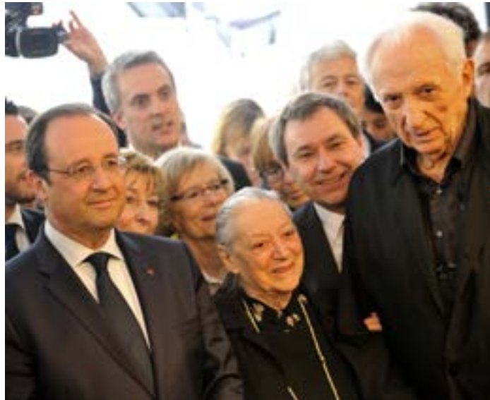
inauguration musée Soulages Rodez - mai 2014 - Photo : C. Meravilles

Le 30 mai 2014, le musée Soulages était inauguré par le Président de la République, François Hollande en présence de Pierre et Colette Soulages et des partenaires.